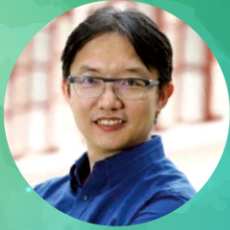
陳志銳博士 南洋理工大學國立教育學院亞洲 語言文化學部副主任 新加坡國家圖書館華文閱讀委員會主席