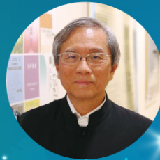
謝錫金教授 香港大學教育學院 中文教育研究中心首席研究員