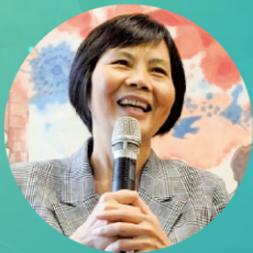
陳昭珍教授 中原大學講座教授 國立臺灣師範大學圖書資訊學研究所 兼任教授 國立臺灣師範大學前教務長