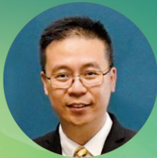
江紹卓先生 香港教育局總課程 發展主任(課程資源)