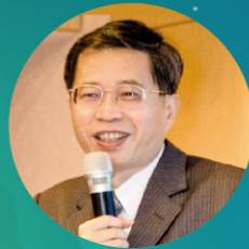
宋曜廷教授 國立臺灣師範大學 副校長